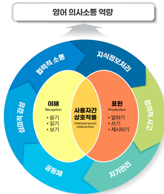
[그림] 영어과 역량 및 영역 구성

영어과 선택 중심 교육과정의 핵심 아이디어는 영어 학습을 통해 학습자가 함양해야 하는 영어 이해 및 표현 활동의 의사소통에 필요한 일반화된 내용이다. 이전 교육과정의 영역별 핵심 개념 및 일반화된 지식을 재정리하고 영어과 역량의 개념을 반영하여 영역별로 핵심어를 추출하였으며, 지식·이해, 과정·기능, 가치·태도의 측면을 고루 포괄하여 기술하였다.